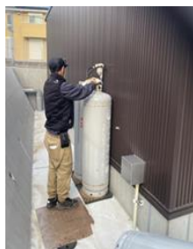
傷や汚れ防止のため敷板をしてボンベを交換する様子

常にLPガスの使用量予測という数字との格闘をしていますが、確実な作業確認と安全確認を心がけて、また、機会はないかもしれない せんがお客様とのコミュニケーション も忘れずに配送業務を行なっていきたいと思っています。