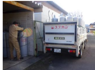
ボンベと高圧ホースの接続中

しかし引継ぎ期間が短かった為、配送場所を覚えることに必死でガスについての詳細を把握しきれず、場所によっては 夏のガス使用量の違い があるということを理解していなかった為に、入社して初めての 冬期にガス切れ をおこしてしまい、お客様に大変ご迷惑をおかけしてしまいました。