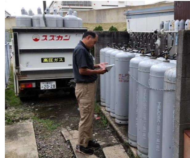
ガスボンベ交換後の確認作業中