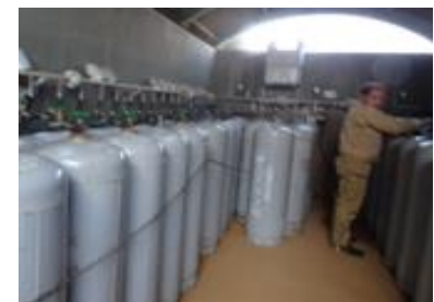
ガスボンベ交換・設置中

ガスの配送の時間帯や、ガスボンベの設置場所の関係でなかなかお客様と顔を合わすことが出来ないのが残念ですが、たまにお会いすることができたときは、お話をさせて頂いております。直にお会いしてお話できることは嬉しいですし、 ありがたいこと だと思います。 ガス配送の仕事では、私は雨の日よりも、 雪の方に危険 を感じます。雪の上を走行しないと滑ったりするからです。以前雪の日にチェーンを巻いて雪のないところを走行中、チェーンが切れてしまったこともあります。 お客様のところに到着するまでの間も十分安全に気を付けていかないとけません。 よく「ガス配送って一人での仕事でしょ。退屈で孤独じゃない？」と言われる。 前職では大きな工場の中で一日中作業をしていたので、 外や世間の様子 が全くわかりませんでした。 今は、配送車に乗って外の景色や、人の動きなどを見ながらガス配達をしているので 一種の解放感 があり、孤独とか退屈というのもあまり感じません。 また、一人での仕事は前職以上に 責任感とやりがい を感じています。 ガスボンベは通常 立てたまま、やや斜めに傾けて転がして いたり、 ガスボンベ専用の一輪車 (通称ネコ車)や台車で運びますが、場所によっては、20kgや30kgのガスボンベを持ち上げたまま、とても狭いところや階段を上ったりすることもあります。