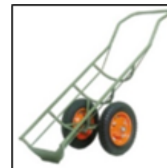
ガスボンベ専用一輪車 (通称 ネコ車)