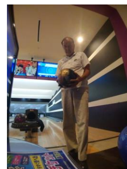
趣味のボーリング中