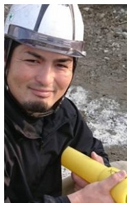
ガス配管工事 作業中

入社してから9年経っても、まだまだ分からない業務知識や内容があります。もっと仕事への理解を深め、日々勉強する姿勢を忘れずに向上心