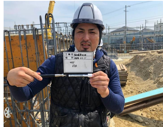
ガス配管工事作業中